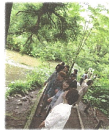
＼子ノ口にて集合写真♪／

院長の講演と3B体操を行います!3B体操は「遊びの要素」「気軽に」「体に無理なく」で老若男女問わず、誰でも楽しめる健康体操です♪是非、参加して心も身体もリフレッシュしましょう◎